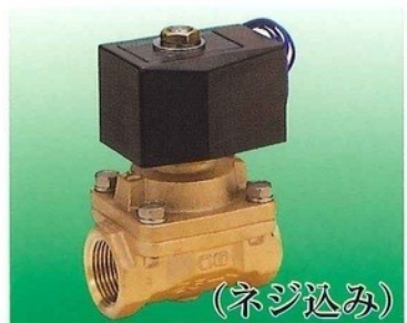
(8A ~ 50A)