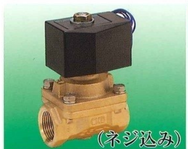
(8A ~ 50A)