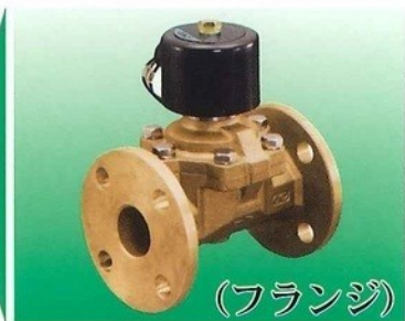
(32A 40A 50A)